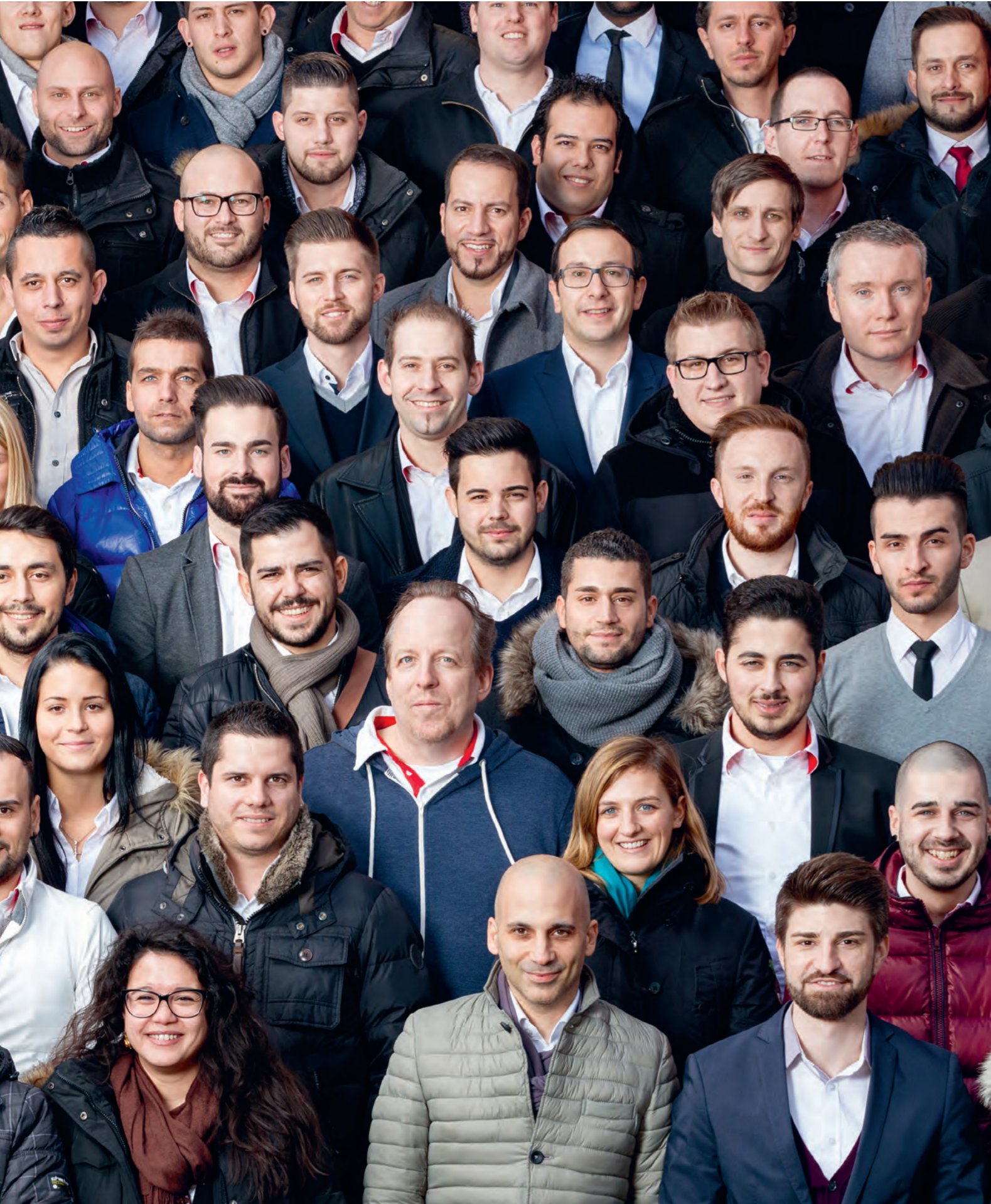
Geschäftsbericht mobilezone holding ag